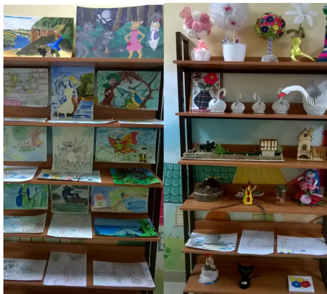
Выставка рисунков и поделок

В ходе этого проекта важную роль заняла работа с родителями. Наши родители с большим энтузиазмом помогали оформить уголок «В мире сказок Г. Тукая», вместе с детьми рисовали иллюстрации к сказкам «Су анасы», «Шурале», «Коза и баран» и др., участвовали в различных мероприятиях, огромное спасибо!